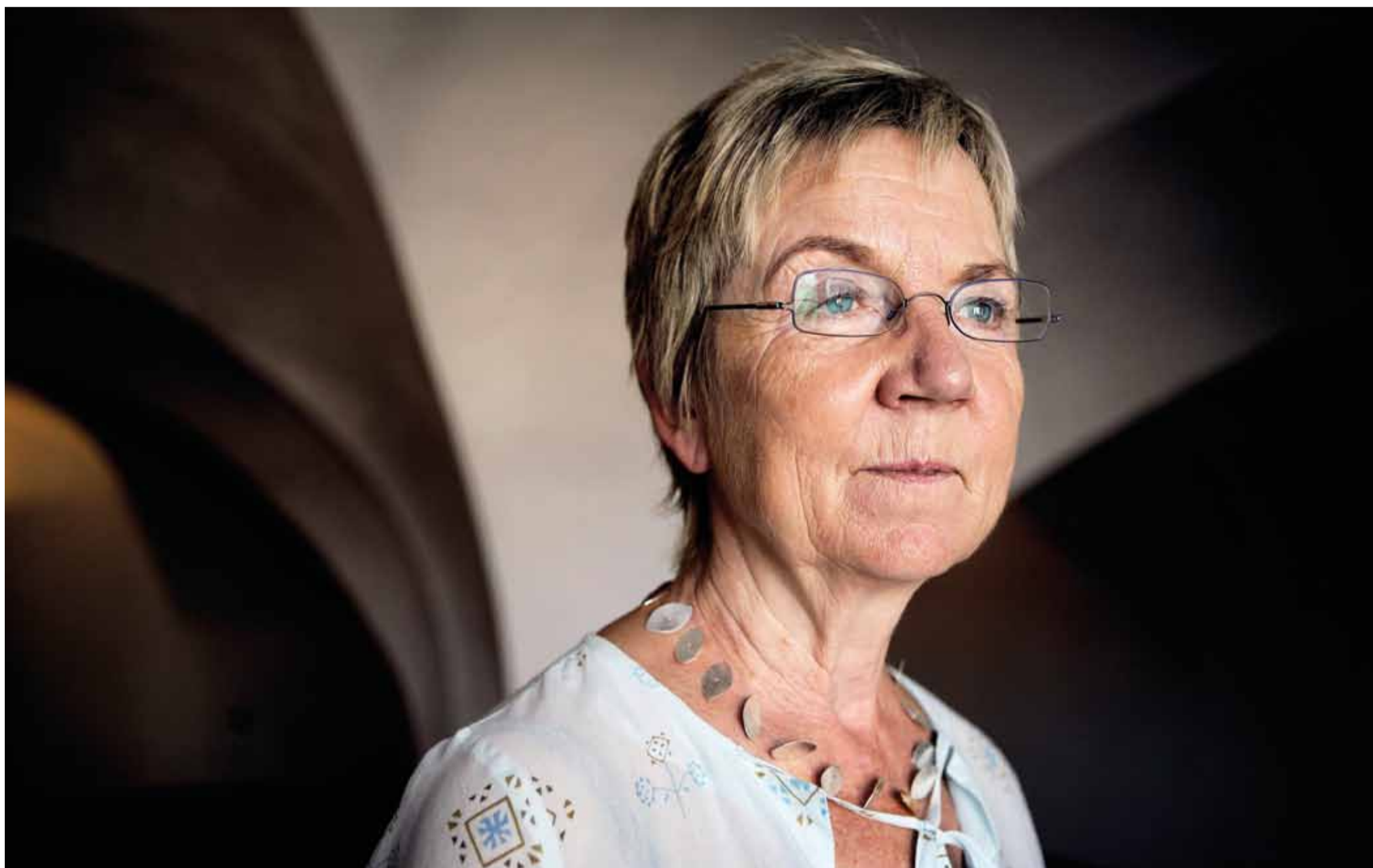
Formand for Radikale Venstres folketingsgruppe Marianne Jelved

Siden valget i september har den radikale folketingsgruppe og de radikale ministre fået gennemført en række markante mærkesager. Foruden Marianne Jelved består gruppen ellers næsten kun af nyvalgte folketingsmedlemmer. Men folketingsgruppen besidder en "naturlig parlamentarisk dygtighed," forklarer gruppeformand Marianne Jelved og gør status over en travl politisk sæson.